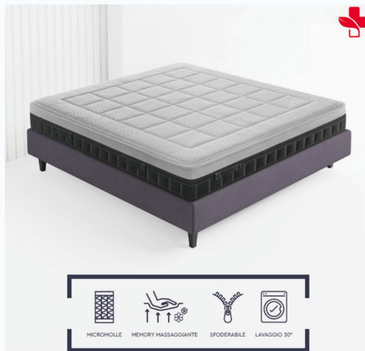
Napoli 3200 micro molle insacchettate